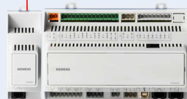
熱量計用 通信モジュール