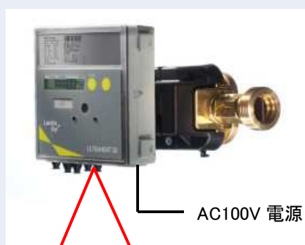
積算熱量計 (アドレス=1)